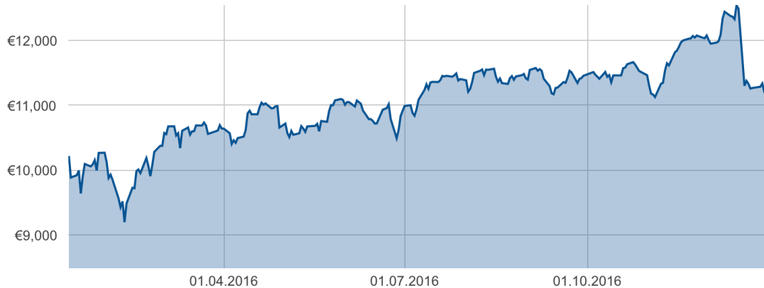
Fig. 2 – Entwicklung des GFDW-Fonds-Kapitalstocks zwischen dem 14.01.16 und dem 30.12.16. Der Kapitalverlust am 19.12.16 wurde durch die Spendenauszahlung verursacht. (Siehe nächstes Kapitel)

Der Fonds wurde mit einem Startkapital von 10.221€ aufgelegt. Am 30.12.2016 betrug der Kapitalstock 11.192€ .